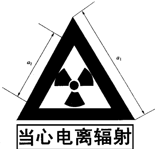
图 F2 电离辐射警告标志

电离辐射的警告标志如图 F2 所示。警告标志的含义是使人们注意可能发生的危险。其背景为黄色，正三角形边框及电离辐射标志图形均为黑色，“当心电离辐射”用黑色粗等线体字。正三角形外边 a_1 = 0.034L ，内边 a_2 = 0.700a_1 ， L 为观察距离。